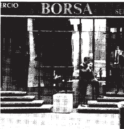
segue da pag. 1 - Le ragioni dei comunisti

proiettata all'infinito. A tale prospettiva non saranno estranee le opposizioni ufficiali, la cui logica politica - mentre si ammantava di antifascismo istituzionale - non è aliena - proprio in nome della difesa di una mitica prima Repubblica aclassista - da velleità di democrazia blindata. Di fronte a questa situazione sarebbe vano sperare che la spontaneità proletaria possa da sé ribaltare il macigno di un quadro devastante. È evidente invece che senza una forte iniziativa politica la spontaneità delle masse finirà per soccombere e adeguarsi all'egemonia reazionaria delle classi dominanti. Crediamo quindi che sia necessario costruire e cominciare a mettere in atto un programma difensivo per impedire che le classi dominanti scarichino le tensioni sociali le une contro le altre, rafforzando il proprio dominio attraverso la concorrenza economica e l'antagonismo politico all'interno dei senza-riserve. Tale programma deve essere qualche cosa di più di un progetto di resistenza economico-sociale. Esso deve sca-